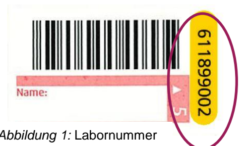
Abbildung 1: Labornummer

Bei der Verwendung von Laboranforderungsscheinen (Muster 10) oder Barcodeetiketten einfach ein Etikett mit der 9-stelligen Auftragsnummer (in Abbildung 1 gelb markiert) auf das Info-Kärtchen für den Patienten kleben (Abbildung 2).