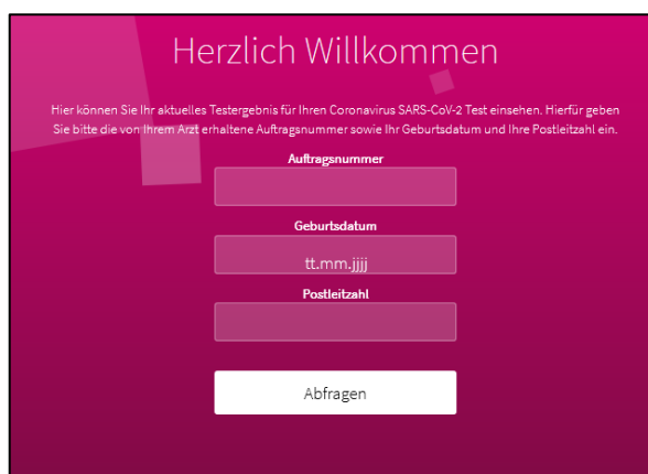
Abbildung 3: https://freiburg.corona-ergebnis.de/

Bei Fragen können Sie gerne unsere Einsenderbetreuung unter der Telefonnummer 0761/31905-555 ansprechen.