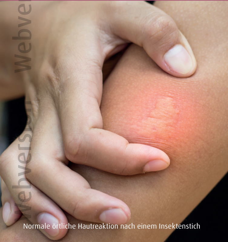
Normale örtliche Hautreaktion nach einem Insektenstich

Etwa 1 bis 3% der Menschen reagieren allergisch auf das Gift bestimmter Insekten. In Deutschland gehören hierzu Bienen, Wespen, Hummeln und Hornissen. Bienen und Wespen haben hierbei aufgrund der weiten Verbreitung und der Nähe zum Menschen die größte Bedeutung.